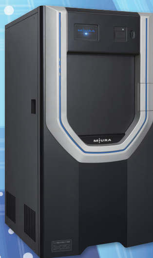
オゾン過酸化水素混合ガス 滅菌器XZ