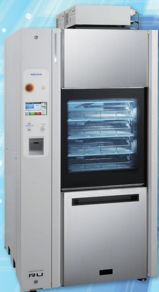
全自動洗浄器RUシリーズ